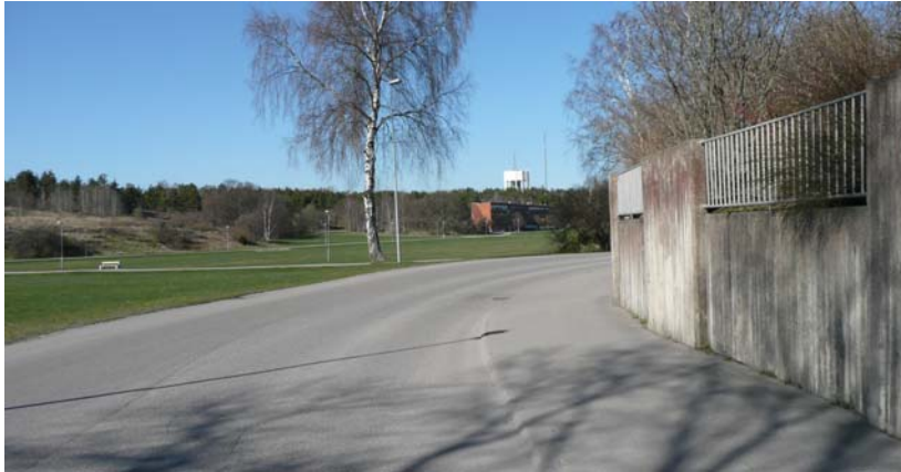
Bild: Skymsikt: Båggatan mot Folkegatan, obs gångbana endast längs innersidan.