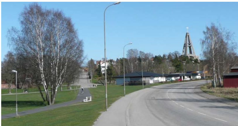
Bild: Föreslaget läge för ny cirkulationsplats "Frösängsrondellen" strax hitom värdshusbyggnaden = ny centrumentré. Torggatan får tydlig centrumkaraktär bortanför entrén, Kyrkogårdsallén får direkt anslutning till Torggatan

Torggatan förändras genom att en ny cirkulationsplats "Frösängsrondellen" föreslås nordväst om Oxelö 7:91 (värdshuset). Dagens ca 12 meter breda körbana föreslås minskas till 7 meter på sträckan sydöst om den föreslagna cirkulationsplatsen. Torggatan förses med kantstensparkering och trädplantering på denna sträcka, liksom även gång- och cykelbana längs båda sidorna.