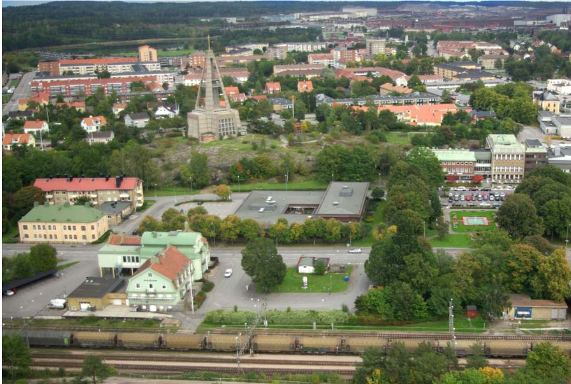
Bild: Flygfoto 2008, stationshuset och "Tullhuset / Pärlan" t.v. vårdcentral och St Botvids kyrka i mitten, Folkets Hus samt Järnvägsparken t.h.