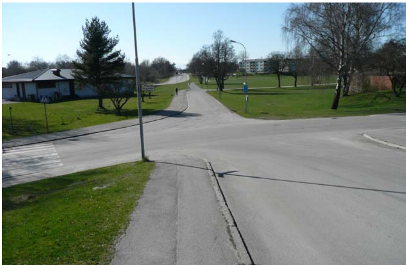
Bild: Trafikfarlig korsning: Höjdgatans backe i anslutning till Båggatan, konflikt med korsande cyklister med hög fart nedför backen.