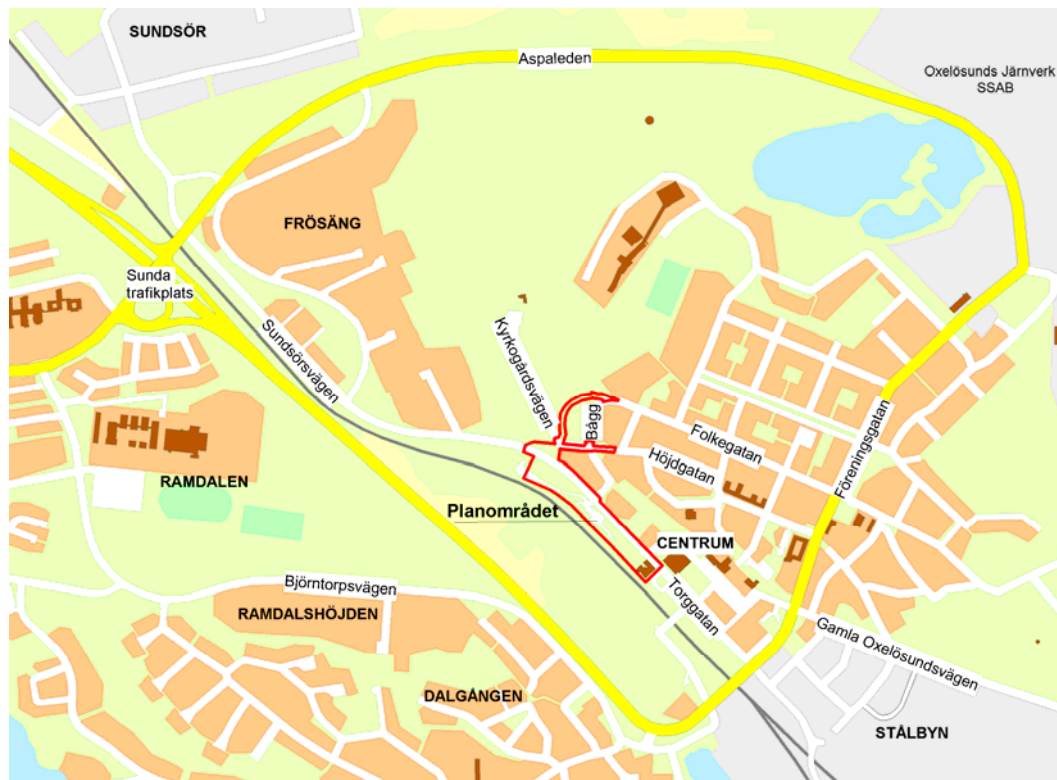
Bild: planområdets avgränsning

Planområdet är beläget omedelbart norr om Oxelösunds centrum mellan Torggatan och bangårdsområdet, inom det markområde som tidigare tillhört TGOJ-bolaget. I sydöst avgränsas området av den f.d. järnvägshotellbyggnaden och mot nordväst av tomten för den f.d. "Byggshopen". Till planområdet hör även nedre delen av Höjdgatan samt Folkegatan förlängning till ny anslutning till Torggatan. Planområdets yta omfattar ca 3,1 ha.