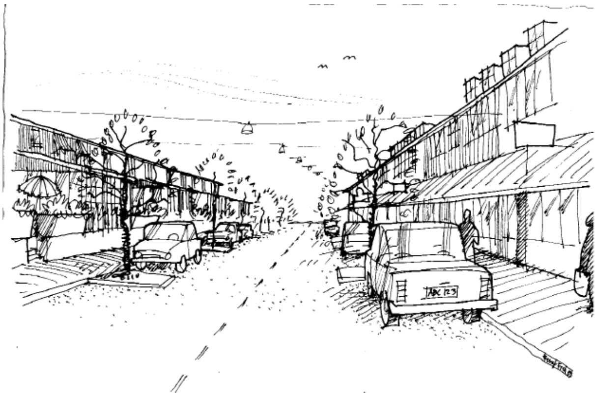
Bild: Perspektiv längs Torggatan med ny bebyggelse i kv Vitsippan t.v. och planområdet t.h.

Genom den nya cirkulationsplaten "Frösängsrondellen" skapas en ny centrumtré som tydligt markerar utvidgningen av Oxelösunds centrum längs Torggatan. Förlängningen av Folkegatan till den nya cirkulationsplaten ger även en enklare orientering för besökare till kyrkogården.