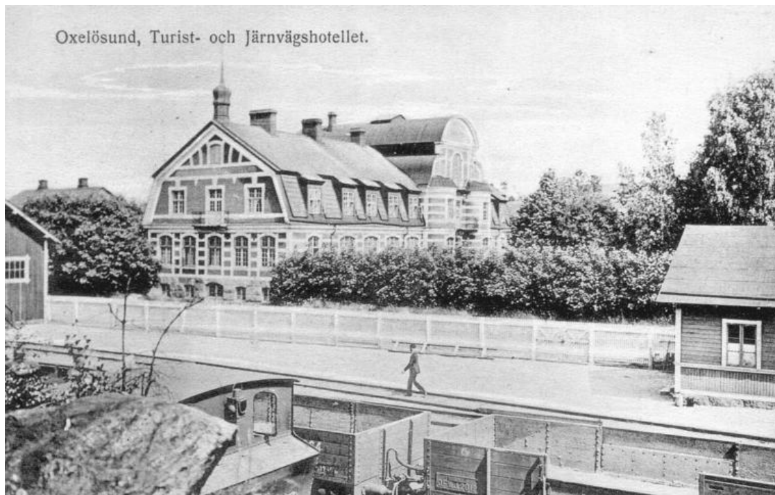
Bild: Vykort från början av 1900-talet visande hotellbygganden i originalutförande

Användning av det befintliga f.d. järnvägshotellet / järnvägsstationen får ske med icke störande verksamhet som är förenlig med bevarandeändamålet, dock inte för permanentboende pga närheten till bangården.