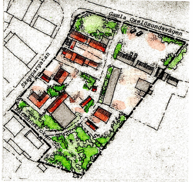
Illustration Skala 1:2000

omfattande fastigheterna OXELÖ 7:87, 7:88 och 7:89 samt del av fastigheterna OXELÖ 7:61 och 7:90 i Oxelösunds stad och kommun, Södermanlands län.