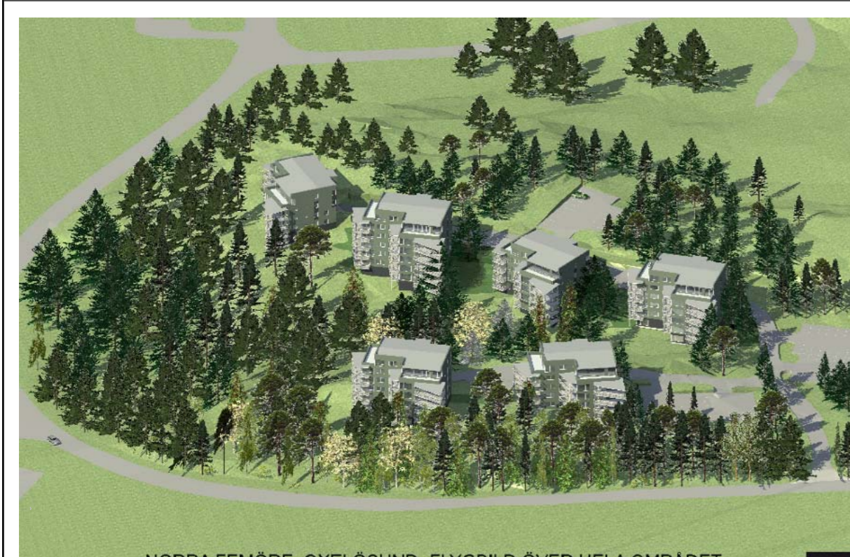
Illustration Illustrationen visar den tänkta bebyggelsens huvudsakliga placering, ej skalenlig.

Skrafferat område har undantagits från antagande enligt Kommunfullmäktiges beslut 2010-04-07 § 28